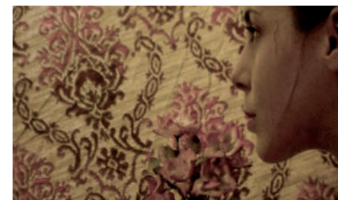
Remember Sammy Jenkins

Tre matrimoni di tre diverse religioni (musulmana, ebrea, indiana) nell'Inghilterra di oggi. Un breve documentario sulla diversità culturale costruito come un mosaico visuale e raccontato con uno split screen creativo, animato e molto colorato.