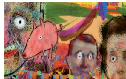
La fiera dei morti

SCENEGGIATURA, MONTAGGIO, MUSICA, EFFETTI VISIVI, PRODUZIONE: M. Manes, L. Di Credico ITALIA, 2002 (Arcipelago 11/2003) ■ Animazione digitale ■ 2' 10"