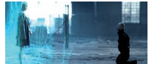
The Silver Rope

Basilea, 19 Aprile 1943: il chimico Albert Hofmann torna a casa in bicicletta dopo una giornata di lavoro in laboratorio. Il film racconta quel celebre "trip", immaginando una psichedelica degli anni Quaranta, con una punta di umorismo.